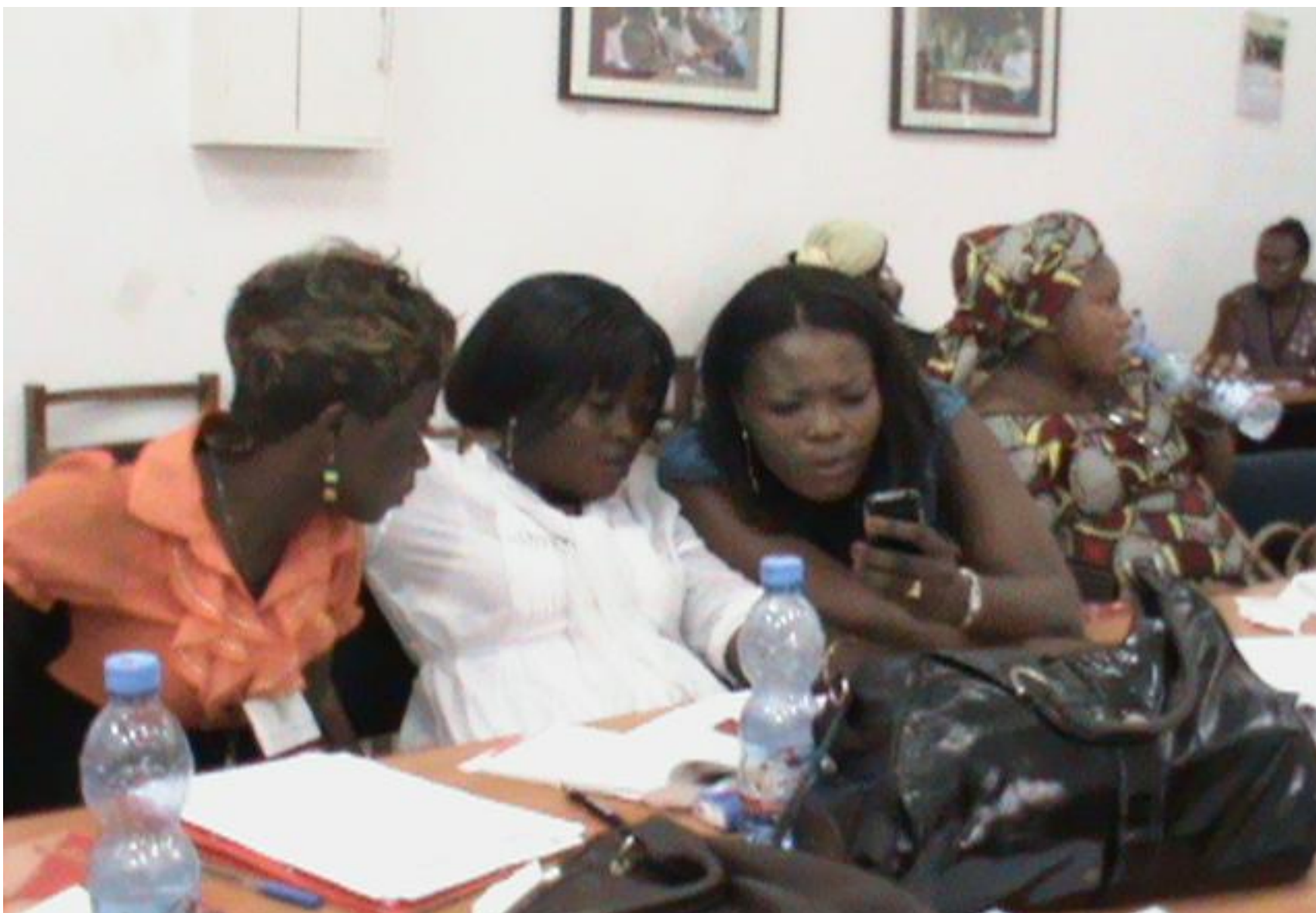
Une attitude de quelques participantes