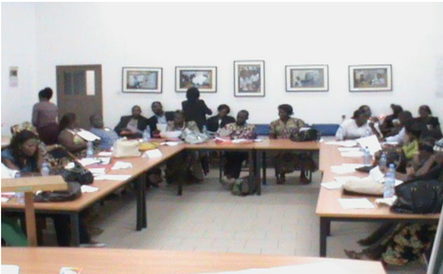
En pleine séance de travail : en haut et en bas