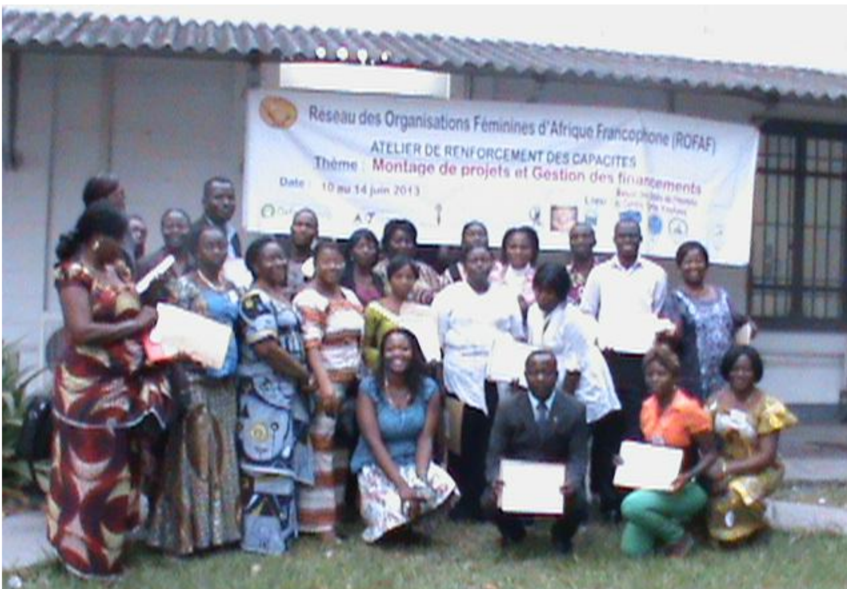
PHOTO-SOUVENIR PRISE LE JOUR DE LA CLOTURE DU SEMINAIRE ATELIER, A LA MAISON DES DROITS DE L'HOMME DU CENTRE CARTER, A KINSHASA, LE 14 JUIN 2013.